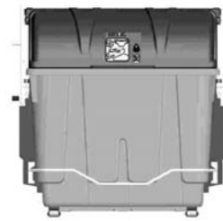
contenedor residuos orgánicos y resto