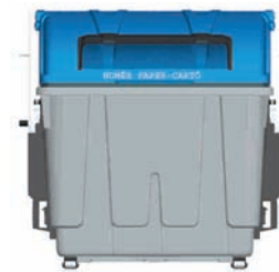
Container de papier et carton